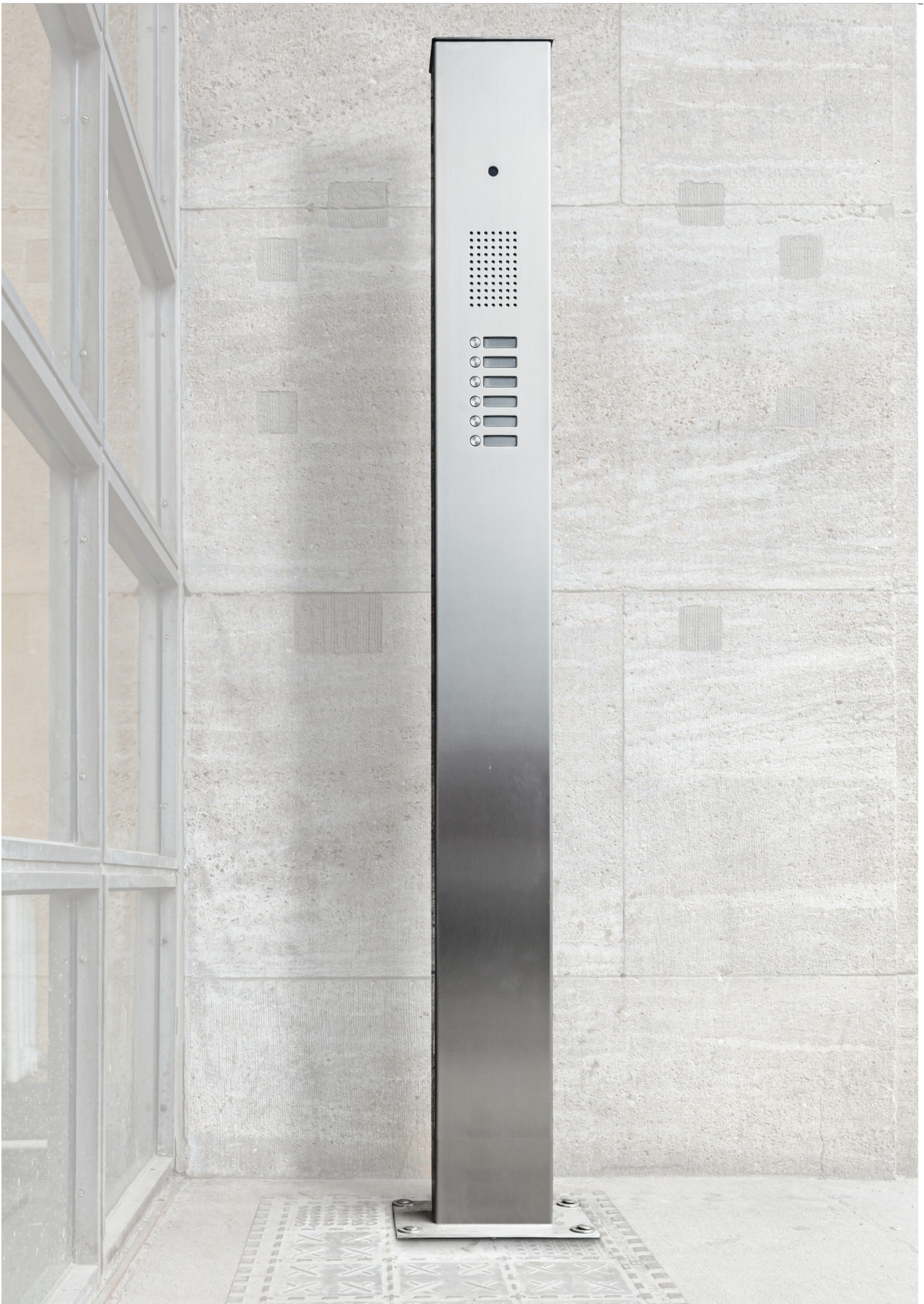
Beispiel-Abbildung, kundenspezifische Sonderausführung