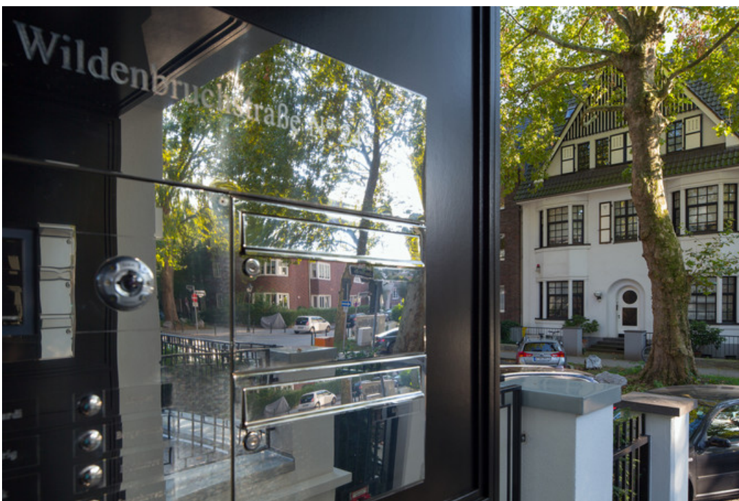
Front Edelstahl poliert