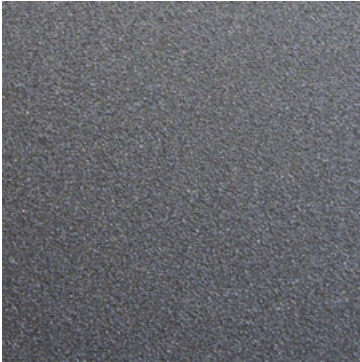
Grundmaterial pulverbeschichtet oder nasslackiert DB703.