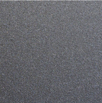
Grundmaterial pulverbeschichtet oder nasslackiert DB703.