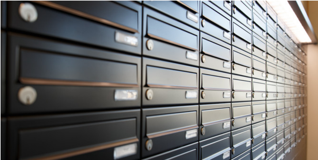
Zwei Fronten ...