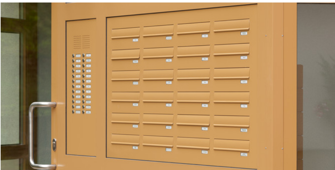
mit pulverbeschichteter Oberfläche