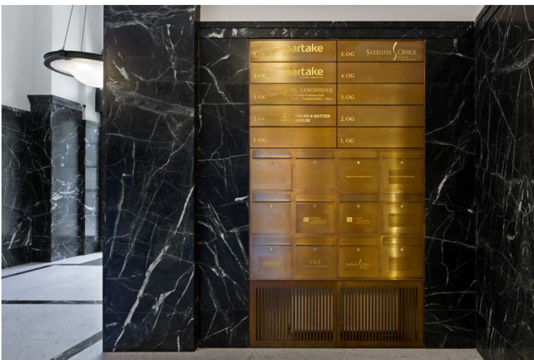
Front Messing geschliffen und patiniert "Baubronze"