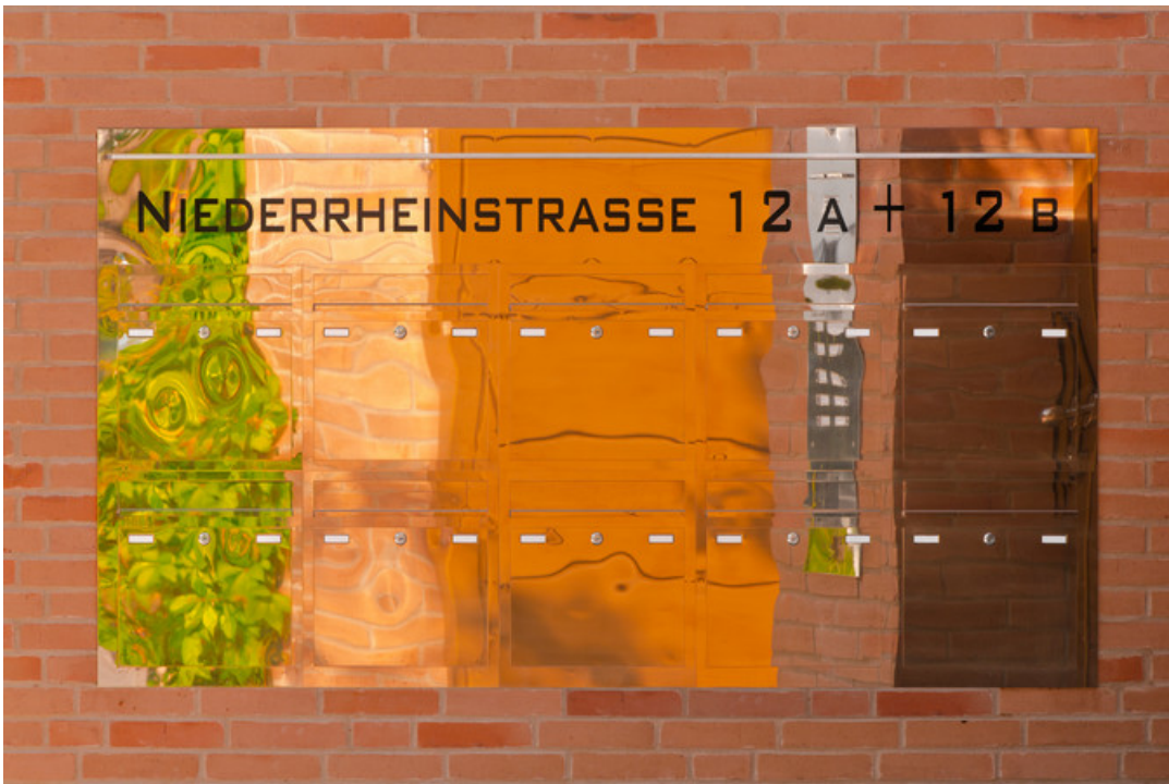
Front Messing poliert