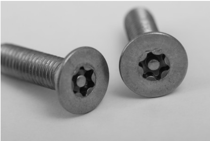
Flächenbündige Sicherheitsschrauben aus Edelstahl