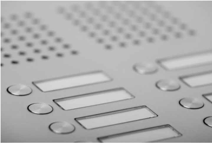
Flächenbündige, korrosionsgeschützte Klingeltaster und Namensschilder