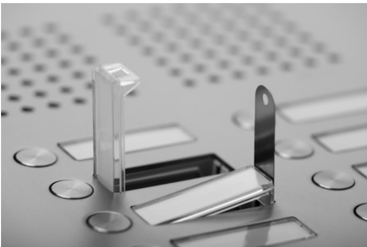
Sekundenschneller Schildwechsel von vorn und mit unsichtbarer Werkzeugeinführung