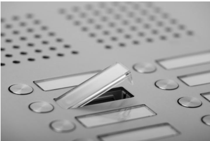
Namensschilder aus schlagfestem und schwer entflammbarem Kunststoff