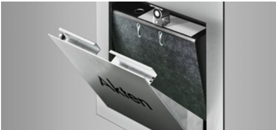
Intellibox Paketboxen und Paketkästen