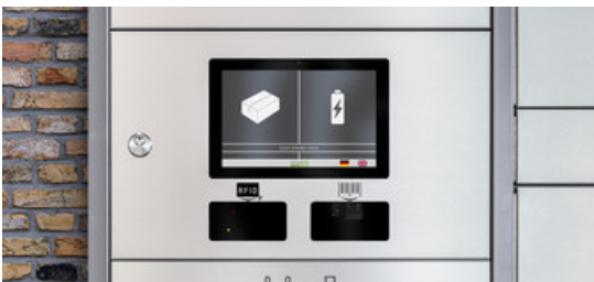
Servicestationen mit Ladefächern