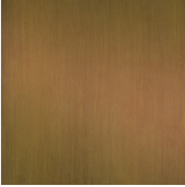
Messing patiniert "Baubronze"