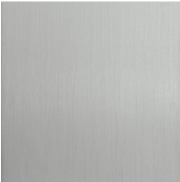
Aluminium eloxiert Silber